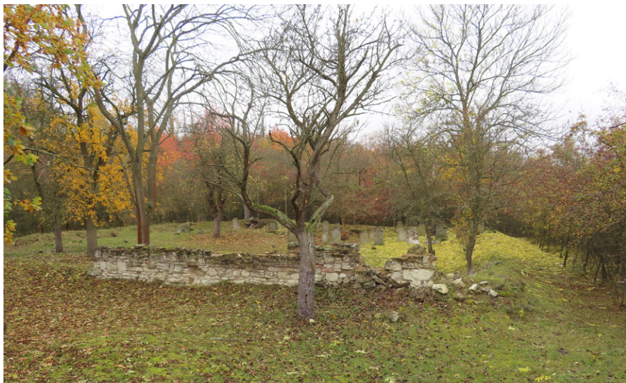
3. Čeradice (okr. Louny) – torzo hřbitovní zdi. 2023.