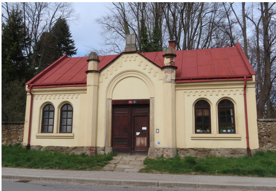
10. Havlíčkův Brod – vstup na hřbitov skrze trojtraktovou budovu obřadní síně.