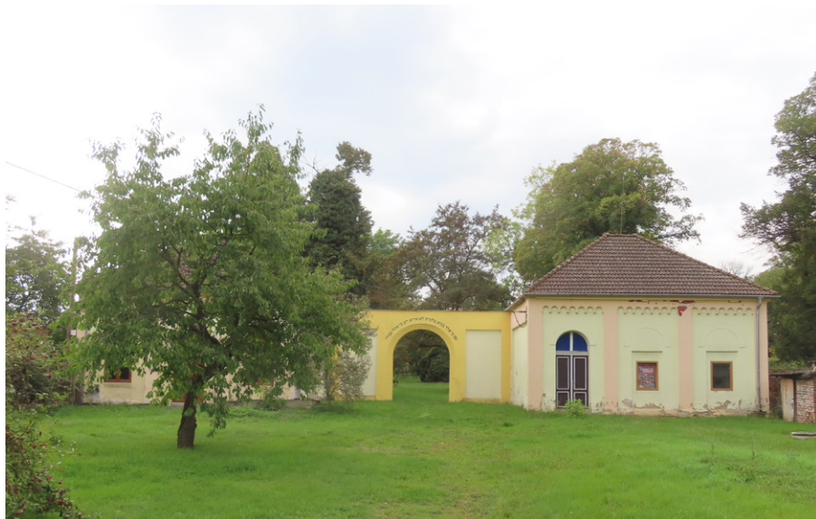
13. Žatec (okr. Louny) – vstupní brána v komplexu hřbitovních budov. Foto autor, 2025.