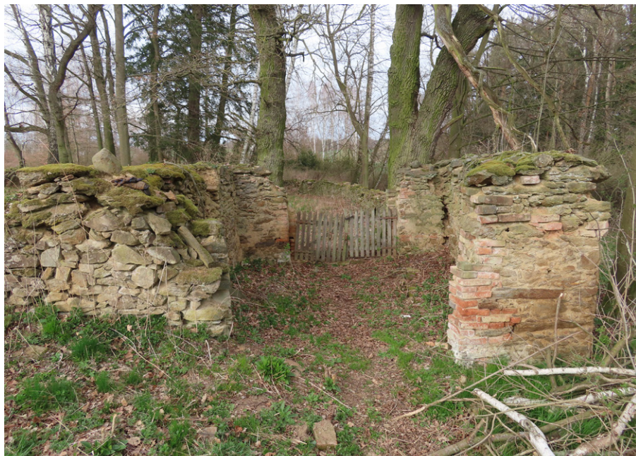
12. Studený (okr. Benešov) – torzo průchozí márnice.