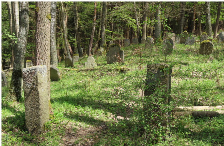
6. Krásná Lípa (zaniklá obec, okr. Sokolov) – kamenné sloupky jsou jedinými pozůstatky původního dřevěného plotu. Foto autor, 2024.