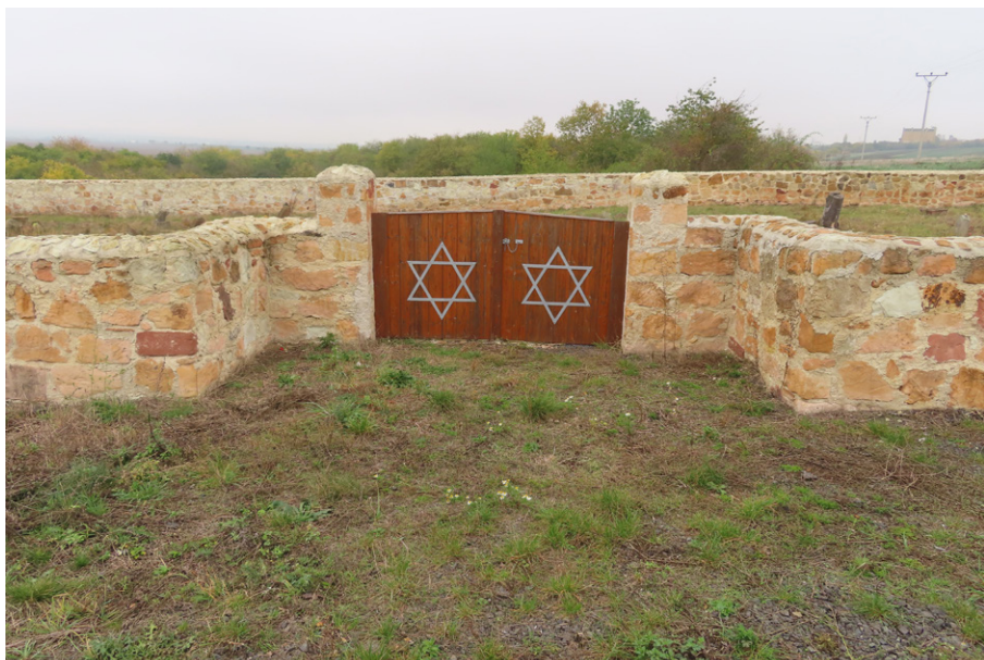
2. Letov (okr. Louny) – novodobá kamenná hřbitovní zeď a brána. Foto autor, 2023.