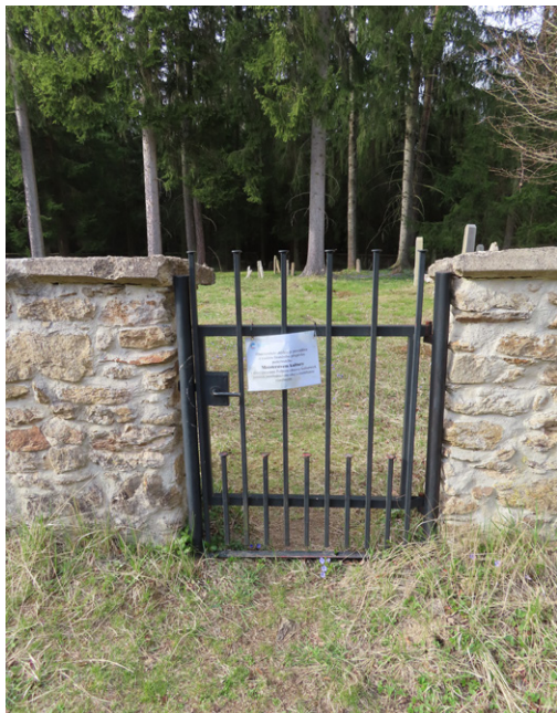
19. Košetice (okr. Pelhřimov) – skromnější hřbitovy mají alespoň branku. Foto autor, 2025.