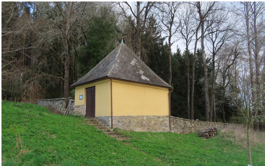
11. Horní Cerekev (okr. Pelhřimov) – vstup na hřbitov skrze márnici. Foto autor, 2025.