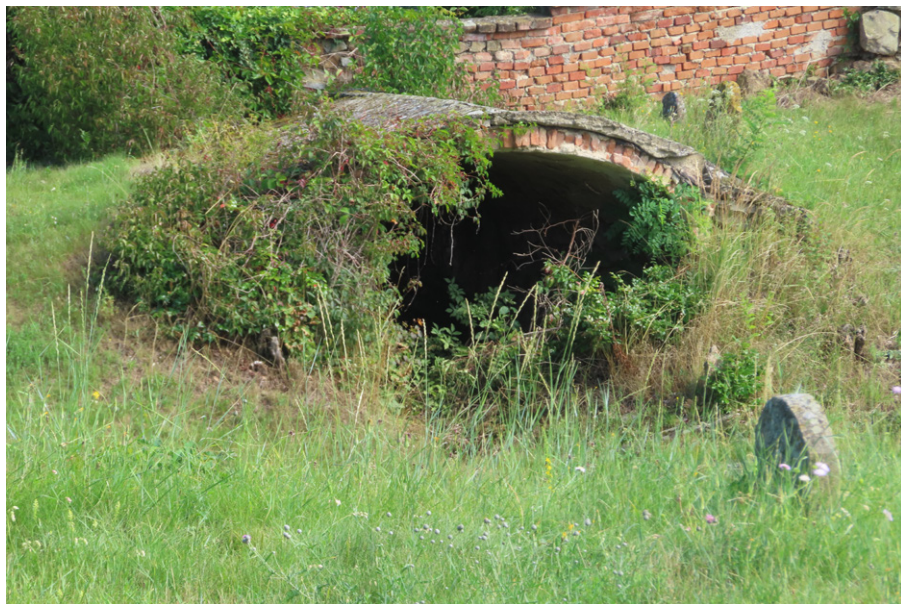
16. Dolní Kounice (okr. Brno-venkov) – původní vstup na hřbitov vedl skrze polozahloubenou průchozí márnici. Foto autor, 2025.