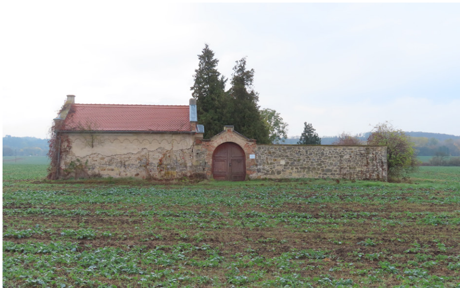
1. Budyně nad Ohří (okr. Litoměřice) – hřbitov s opravenou kamennou zdí a cihelnou hřbitovní bránou. Foto autor, 2023.