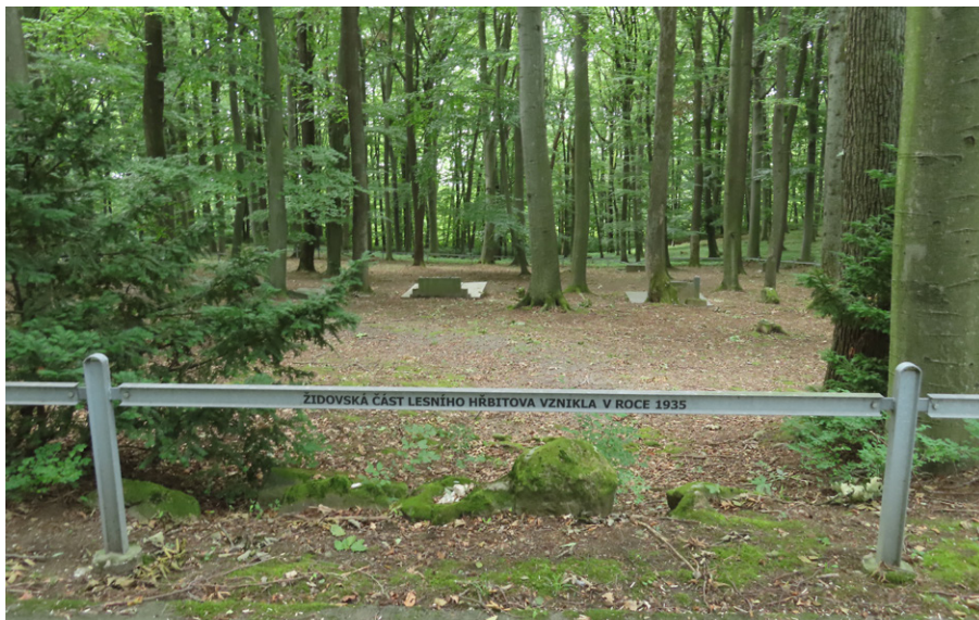
9. Zlín – moderní symbolické oplocení židovského oddělení komunálního hřbitova. Foto autor, 2025.