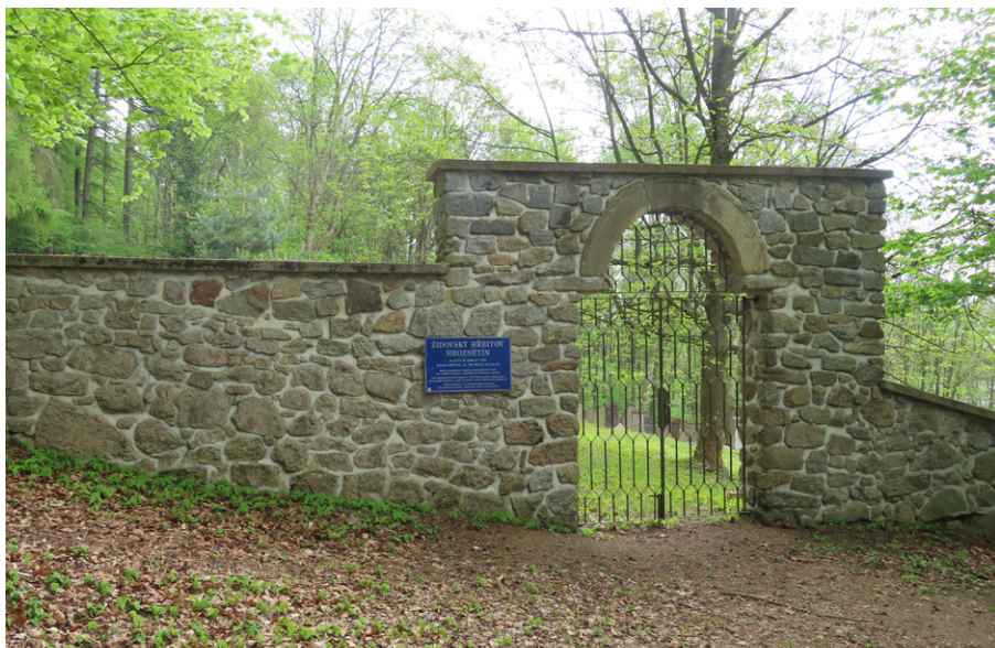
18. Hroznětín (okr. Karlovy Vary) – soudobá úprava vstupní brány.