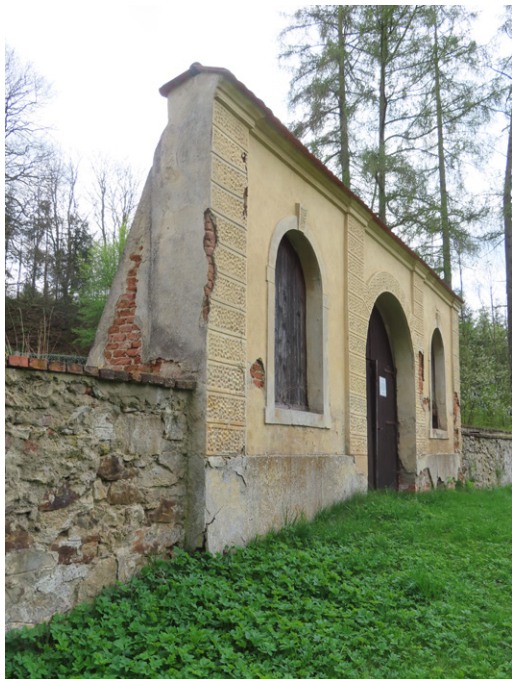
15. Brtnice (okr. Jihlava) – nový židovský hřbitov. Torzo průchozí obřadní síně dnes slouží jako vstupní brána. Foto autor, 2025.