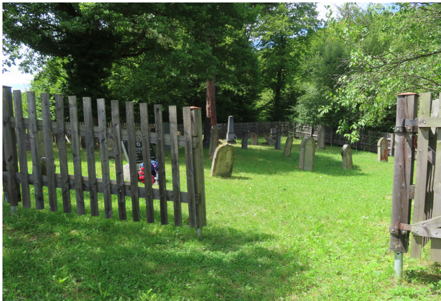
7. Brumov(-Bylnice) (okr. Zlín) – novodobý laťový dřevěný plot. Foto autor, 2025.