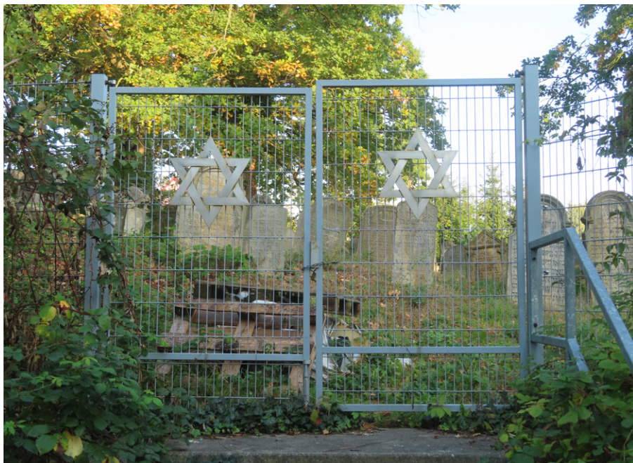
4. Sobědruhy (m. č. Teplic, okr. Teplice) – hřbitovní oplocení z kovových dílců. Foto autor, 2025.