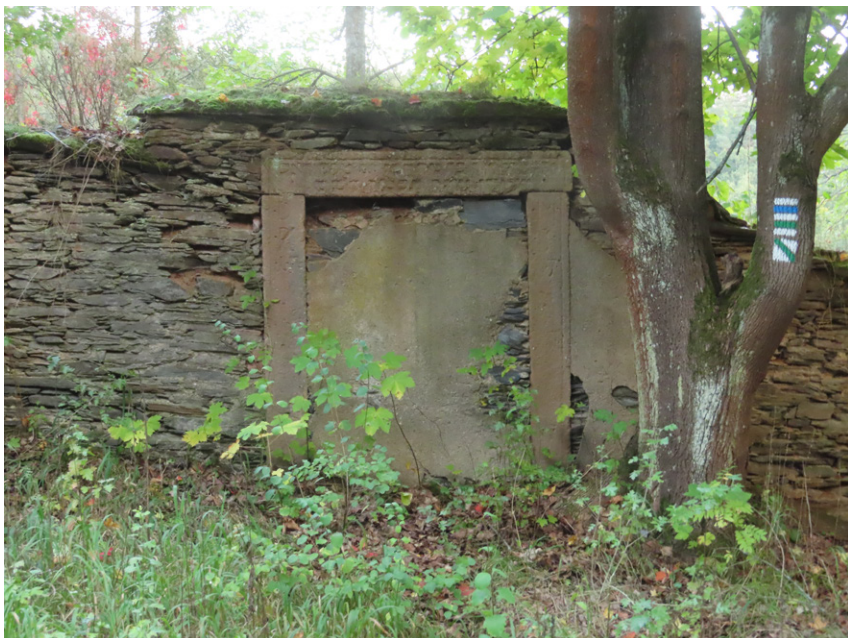
20. Rabštejn nad Střelou (okr. Plzeň-sever) – zarděný vstupní portál hřbitova z důvodu navýšení nivelety pohřebiště kvůli pohřbívání ve vrstvách. Foto autor, 2025.