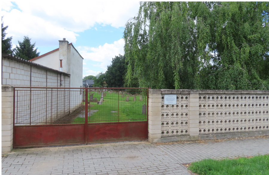
5. Pohořelice (okr. Brno-venkov) – moderní hřbitovní zeď a funkční brána. Foto autor, 2025.