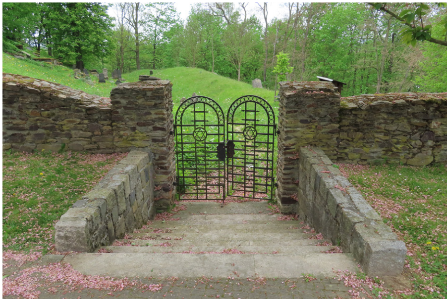
17. Kynšperk nad Ohří (okr. Sokolov) – soudobé provedení vstupní brány židovského hřbitova. Foto autor, 2024.