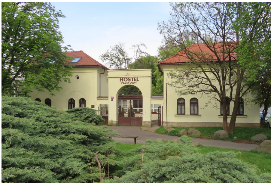
14. Praha-Libeň – nový židovský hřbitov. Příklad komerčního využití komplexu vstupních budov židovského hřbitova.