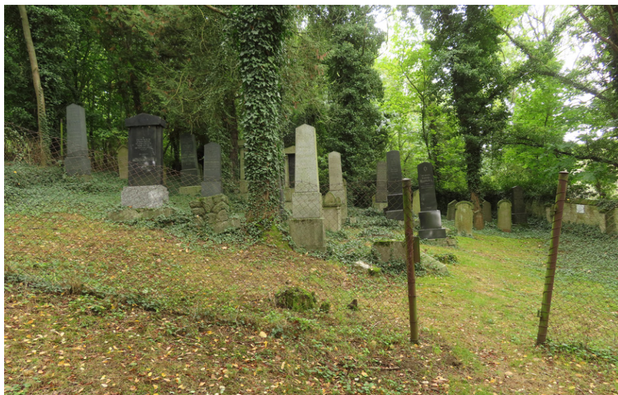
8. Švihov (okr. Klatovy) – provizorní oplocení nového židovského hřbitova z drátěného pletiva. Foto autor, 2025.